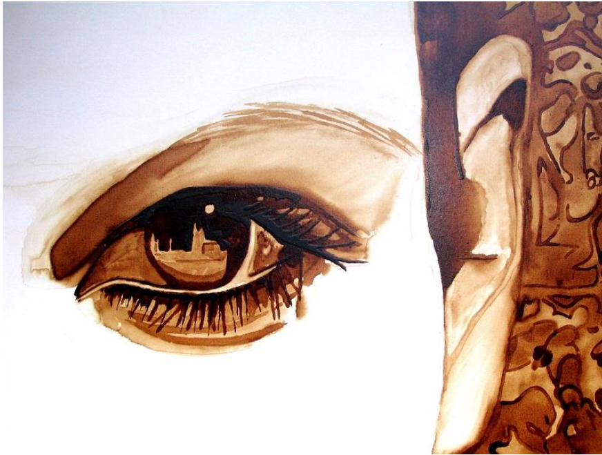
Köln im Augenblick

Auszug seiner Reihe „Ein augenblicklicher Genuss“ – Kaffeearbeiten: